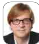
Guy Verhofstadt EDLA taldeko Lehendakaria

Europako Demokrata eta Liberalen Aliantza (EDLA) Europako Legebiltzarreko hirugarren talde politiko garrantzitsuena da, Europa kontinente osokoak diren partidu politikoetako eurolegebiltzarkideez osatua. Europaren aldeko programa bat daukan zentroko indar sendo bat gara. Europako herrialde guztiek nazioarteko hainbat erronkei aurre egin behar die, bai ekonomiaren atzerapenari, nazioarteko banku erakundeen oinarrien galerari, klima aldaketari, nazioarteko terrorismoari edo energia horniduraren segurtasunari.